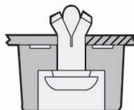
DOPO L' INSERIMENTO AFTER INSERTION